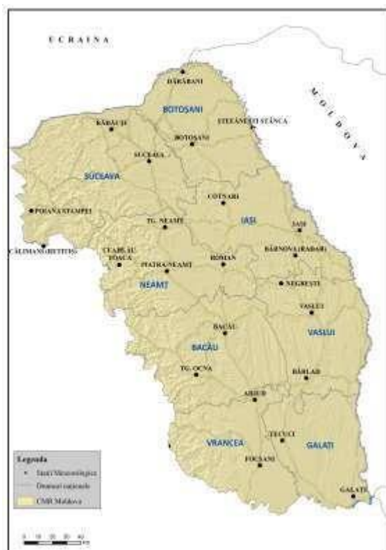
Centrul Meteorologic Regional Moldova

Stațiile meteorologice administrate de C.M.R. Moldova sunt încadrate în județele: Vrancea, Galați, Bacău, Vaslui, Neamț, Iași, Suceava, Botoșani.