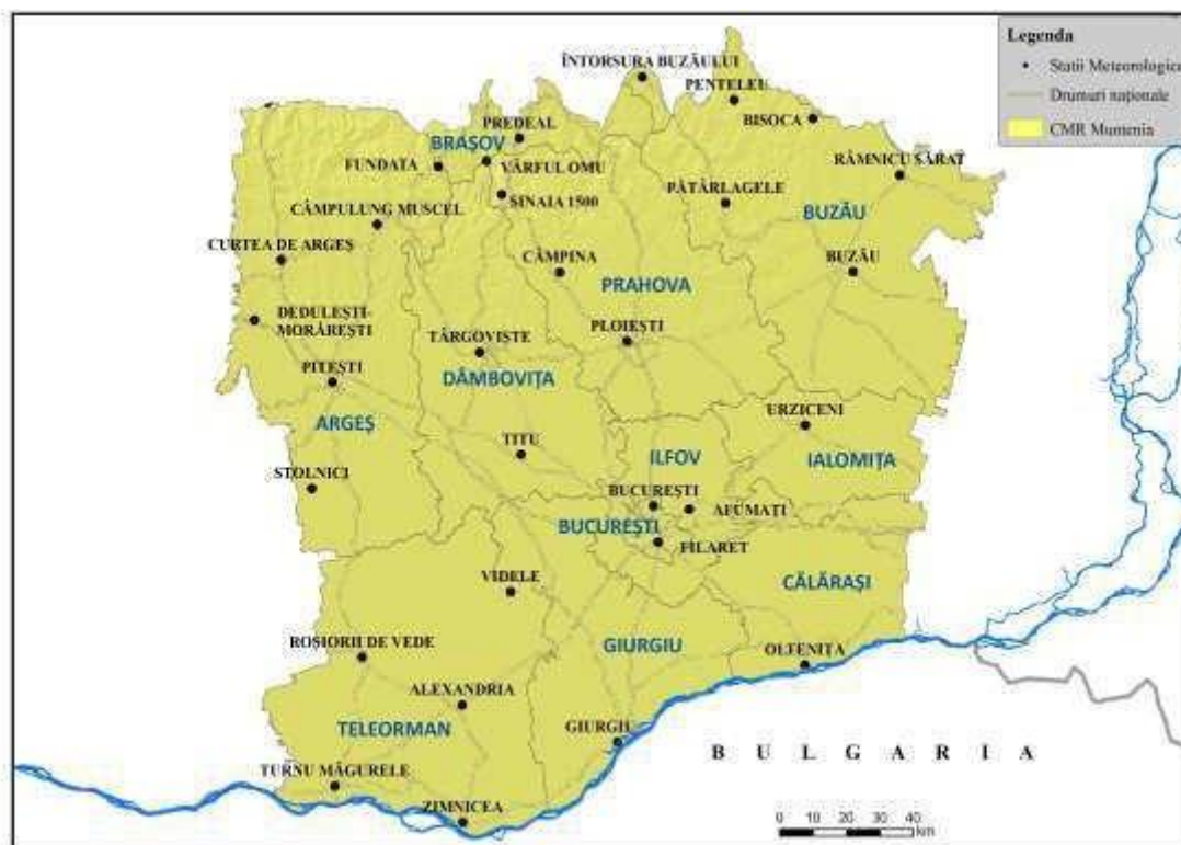
Centrul Meteorologic Regional Muntenia

Stațiile meteorologice administrate de C.M.R. Muntenia sunt încadrate în județele: Ilfov, Giurgiu, Teleorman, Argeș, Dâmbovița, Prahova, Călărași, Covasna, Ialomița, Buzău, Brașov și Municipiul București.