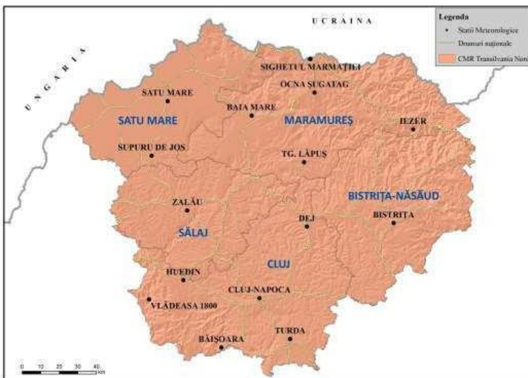
Centrul Meteorologic Regional Transilvania Nord

Stațiile meteorologice administrate de C.M.R. Transilvania Nord sunt încadrate în județele: Cluj, Sălaj, Satu Mare, Maramureș, Bistrița-Năsăud.