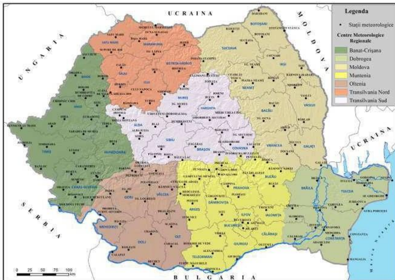
Rețeaua națională de stații meteorologice

Cele 7 Centre Meteorologice Regionale (CMR) sunt conform legii, unități fără personalitate juridică și sunt organizate după principiul omogenității climatice a teritoriului României, în conformitate cu recomandările internaționale în domeniu. Acestea asigură realizarea obiectului de activitate al Administrației Naționale de Meteorologie la nivel regional și local.