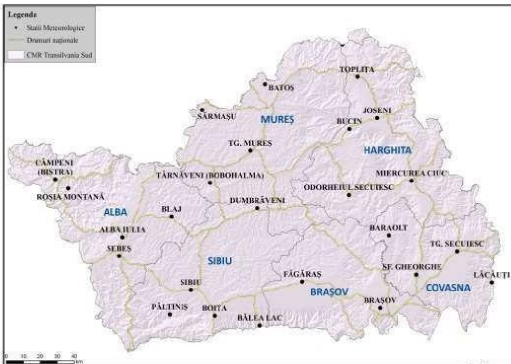
Centrul Meteorologic Regional Transilvania Sud

Stațiile meteorologice administrate de C.M.R. Transilvania Sud sunt încadrate în județele: Sibiu, Brașov, Alba, Mureș, Covasna, Harghita.