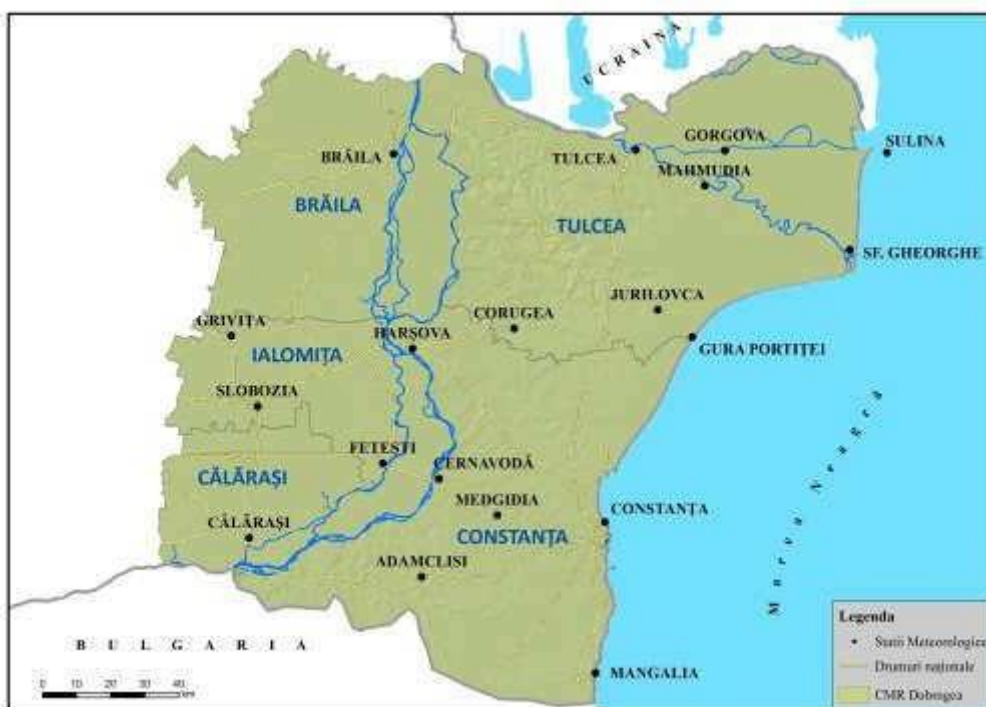
Centrul Meteorologic Regional Dobrogea

Stațiile meteorologice administrate de C.M.R. Dobrogea sunt încadrate în județele: Constanța, Tulcea, Brăila, Calarași, Ialomița.